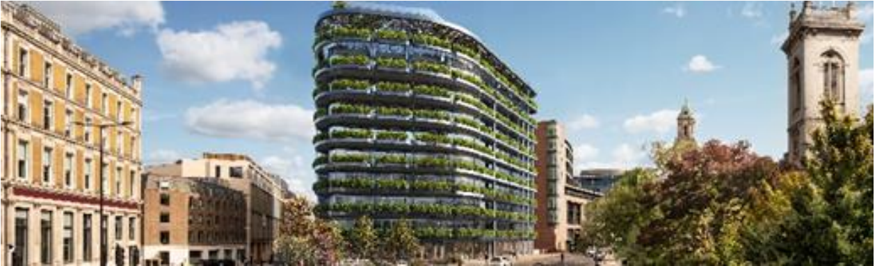
40 Holborn Viaduct

*Detaylı bilgi ING Global Faaliyet Raporu 2025